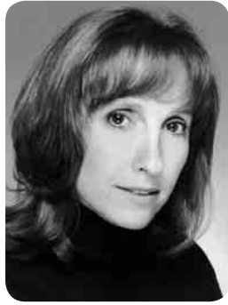
לינור רובן, נשיאת עלם ארה"ב