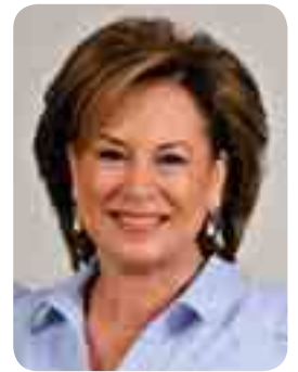
נאוה ברק, נשיאת עלם